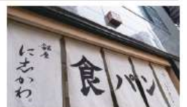
この暖簾が目印です。