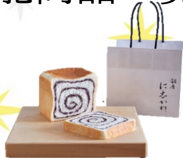
あん食パンは1,000円(税込) 月初め食パンは1,080円(税込) ※写真はあん食パンです

高級食パンを使って一つ一つ手作りの和加らすく！ 和三盆・黒蜜きなこ・抹茶の3種類があり一口サイズで 食べやすく口に運びやすいので自分へのご褒美などにいかがでしょうか？